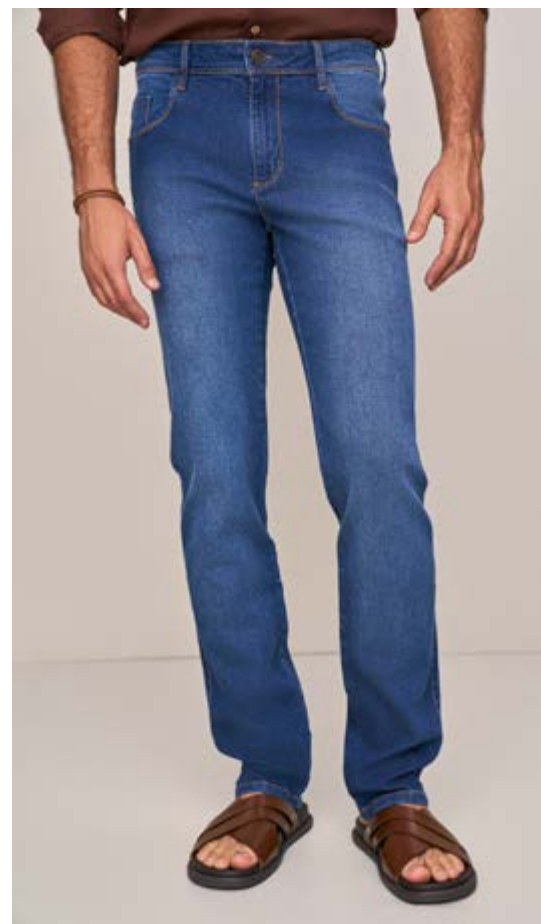
100057 AZUL JEANS