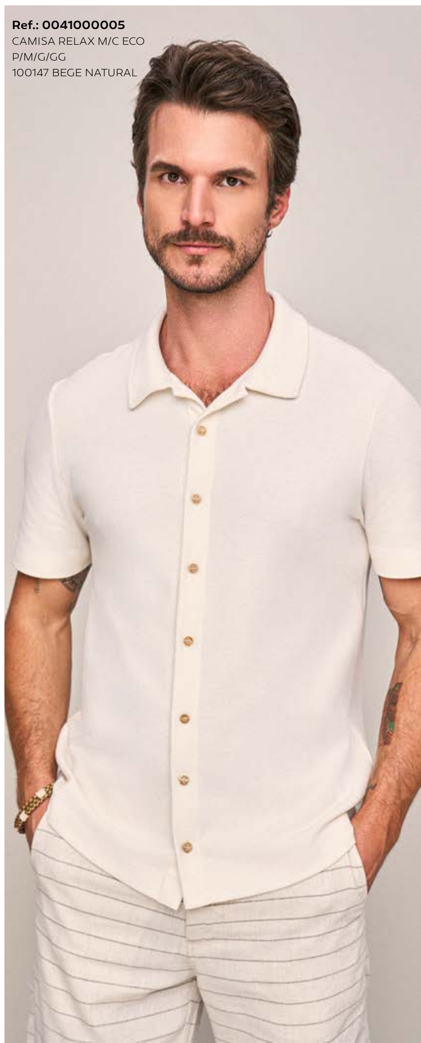
Ref.: 0041000005 CAMISA RELAX M/C ECO P/M/G/GG 100147 BEGE NATURAL