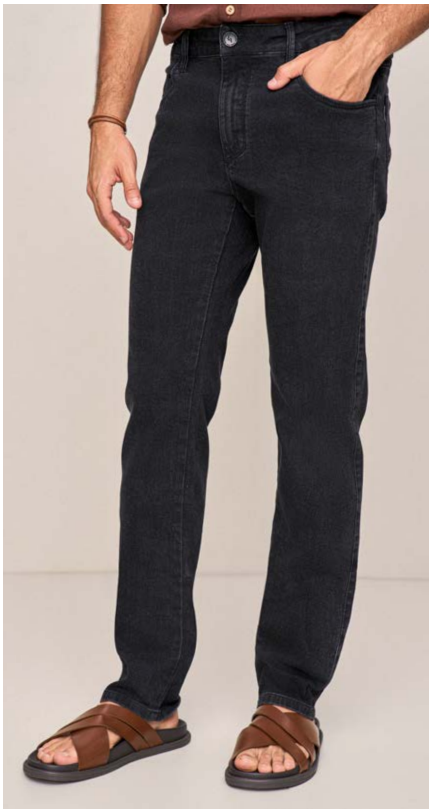
Ref.: 01013100079 CALÇA RODRIGO (RETA) ESSENCIAL 38 AO 48 100018 BLACK STONE (FOTO)