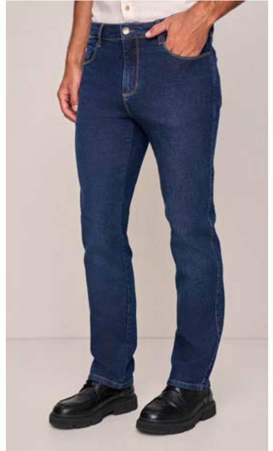
100009 INTENSE BLUE