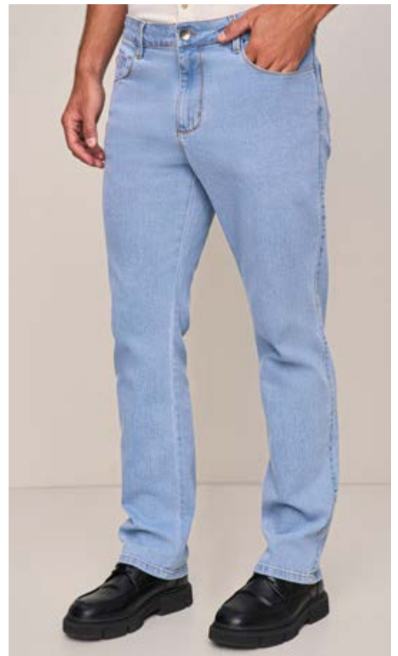
100054 AZUL CLARO