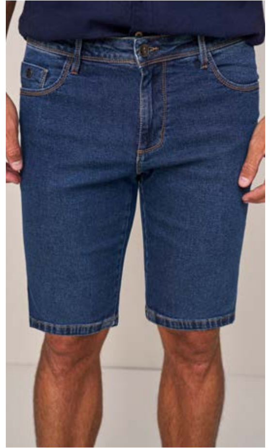
100057 AZUL JEANS