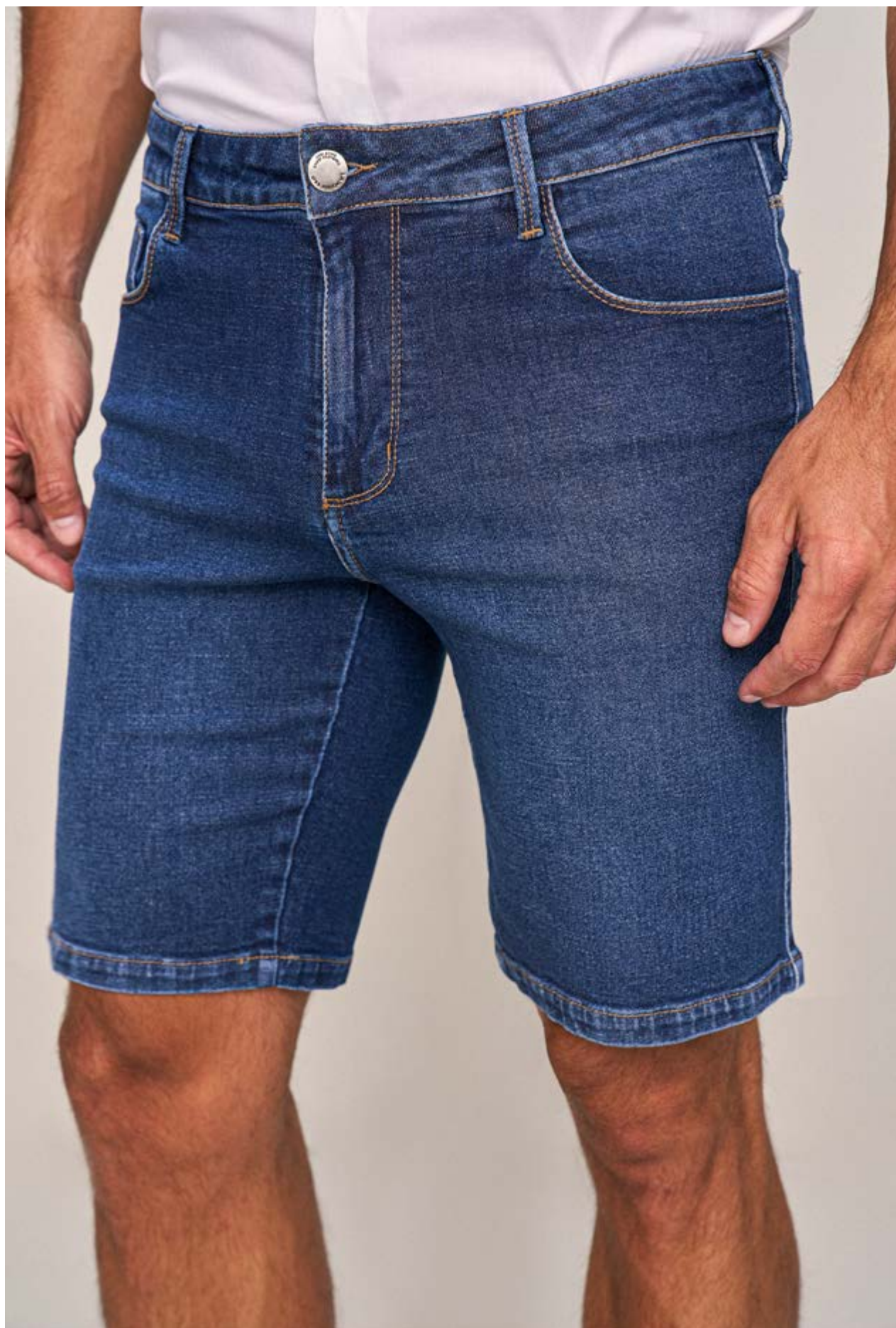
Ref.: 01001400009 BERMUDA MARCELLO (SLIM) PRICE 38 AO 50 100009 INTENSE BLUE