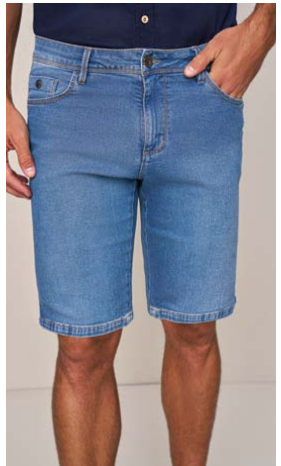
100054 AZUL CLARO