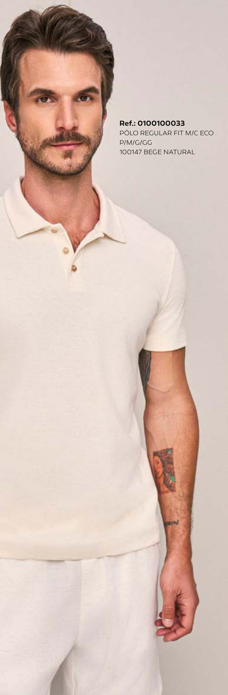
Ref.: 0100100033 PÓLO REGULAR FIT M/C ECO P/M/G/GG 100147 BEGE NATURAL