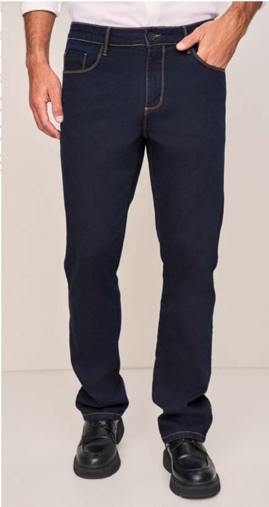
Ref.: 1014300040 CALÇA RICHARD (TRADICIONAL) ESSENCIAL 38 AO 54 100187 BLACK BLUE