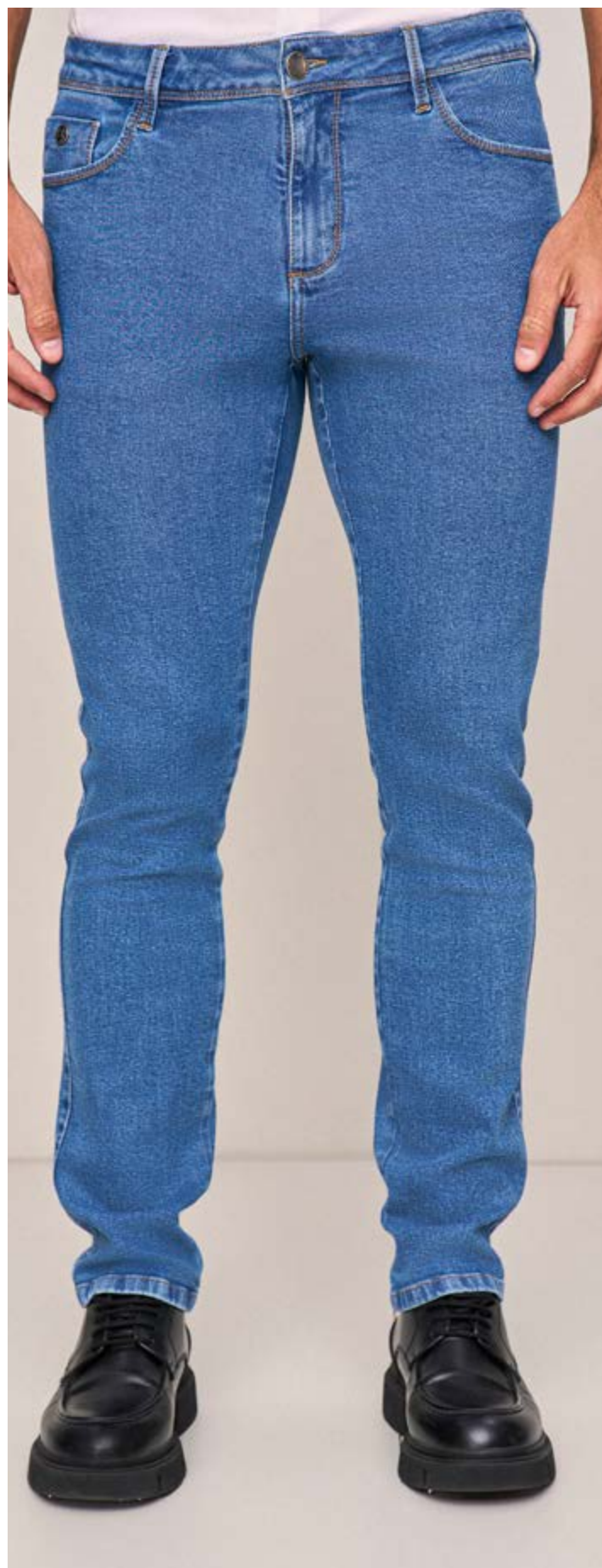
Ref.: 1013900047 CALÇA MARCELLO (SLIM) PRICE 36 AO 48 100057 AZUL JEANS