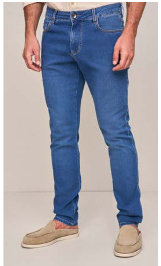
100010 AZUL MÉDIO