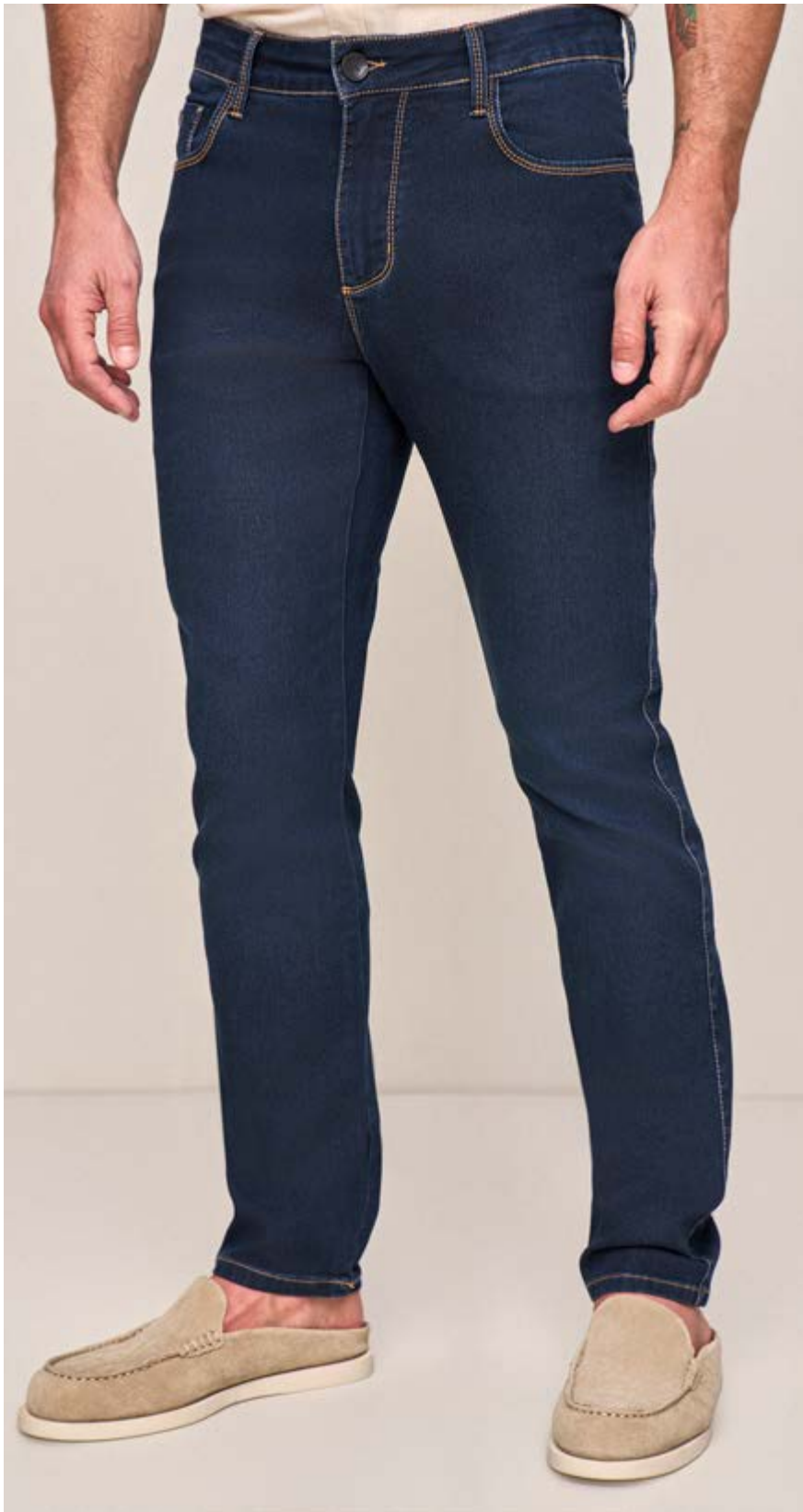
Ref.: 101390066 CALÇA MARCELLO (SLIM) ESSENCIAL 36 AO 46 100187 BLACK BLUE