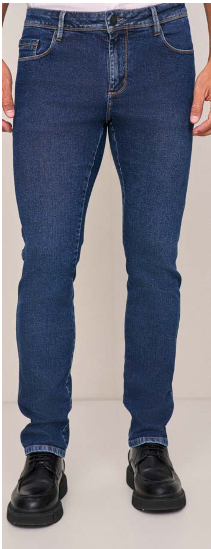
Ref.: 1013900046 CALÇA MARCELLO (SLIM) PRICE 36 AO 48 100056 DARK ÍNDIGO