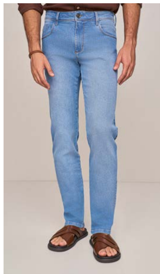
100054 AZUL CLARO