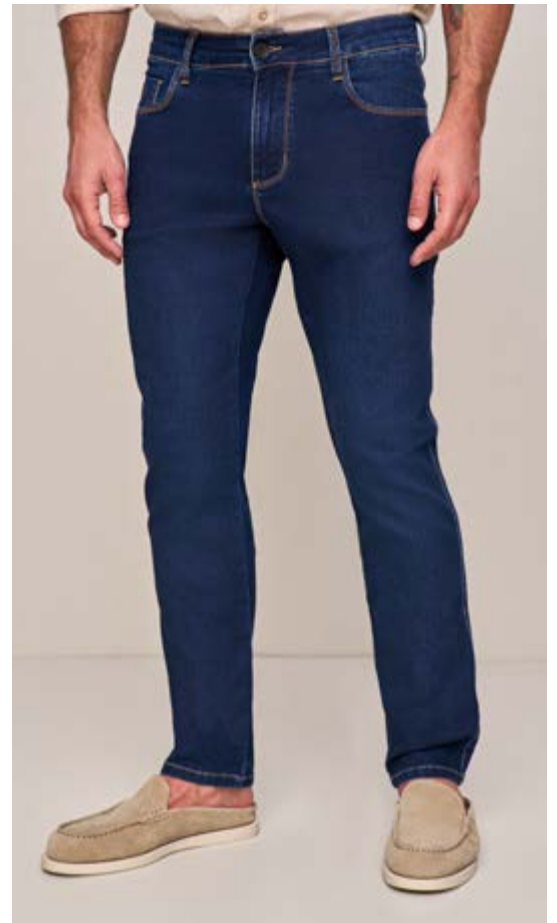
100009 INTENSE BLUE