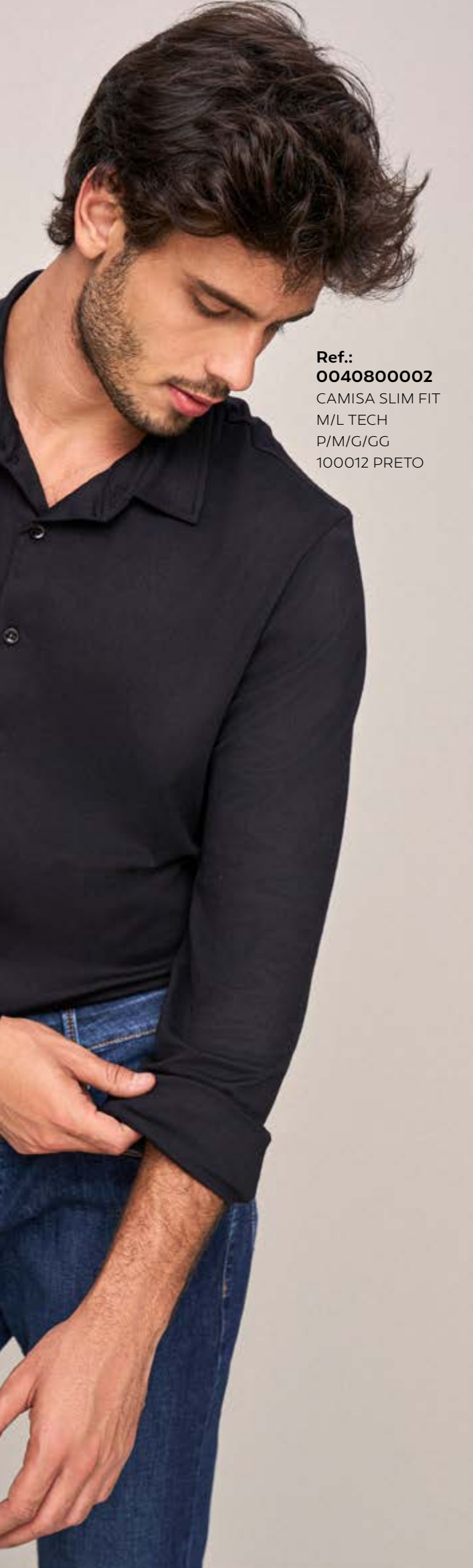
Ref.: 0040800002 CAMISA SLIM FIT M/L TECH P/M/G/GG 100012 PRETO