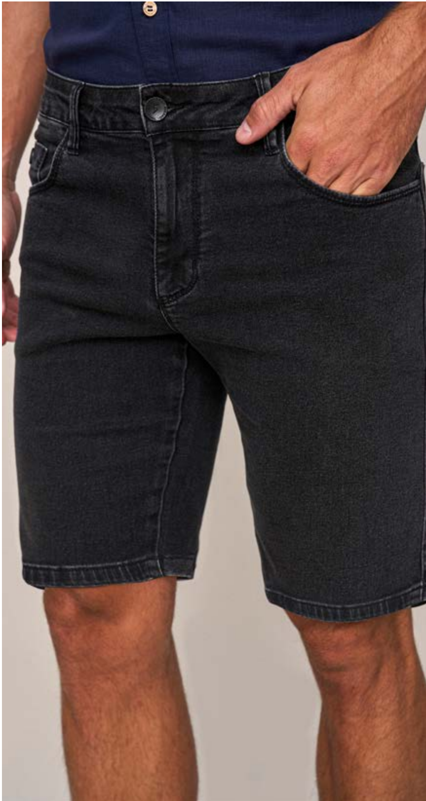
Ref.: 1001800010 BERMUDA RODRIGO (RETA) ESSENCIAL 38 AO 50 100018 BLACK STONE (FOTO)