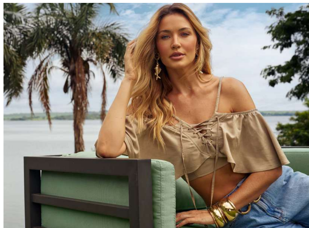
RENASCER PRIMAVERA 2026 ASD JEANS