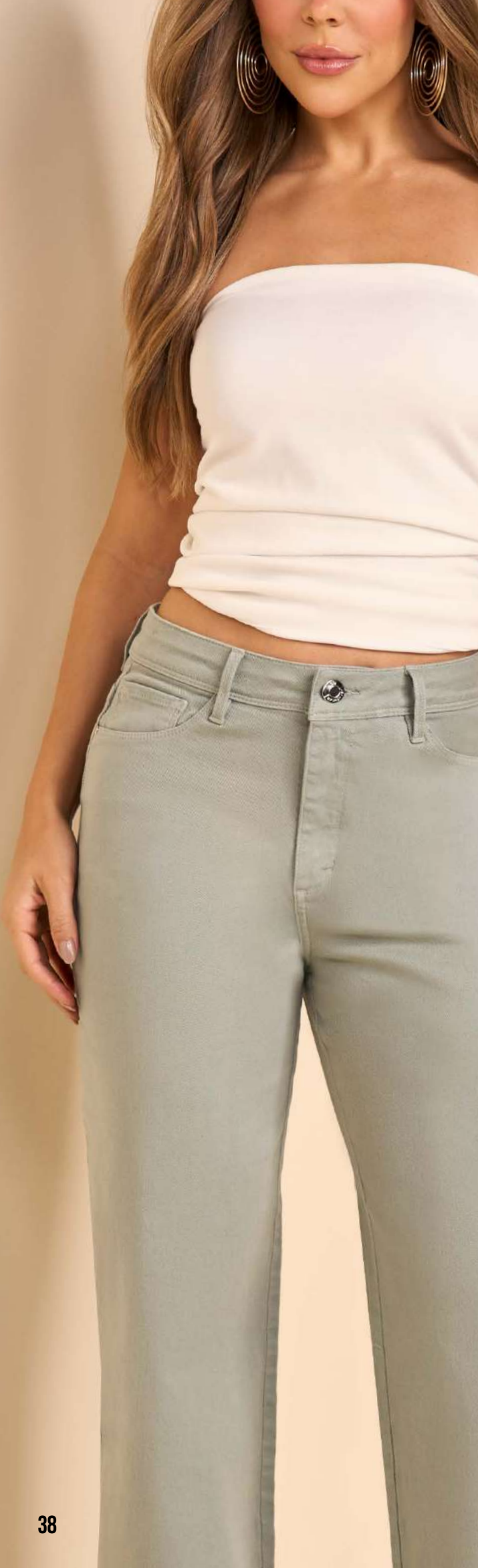
CALÇA WIDE LEG REF: 1014400056 TAM: 36 AO 50 BRANCO VERDE CLARO