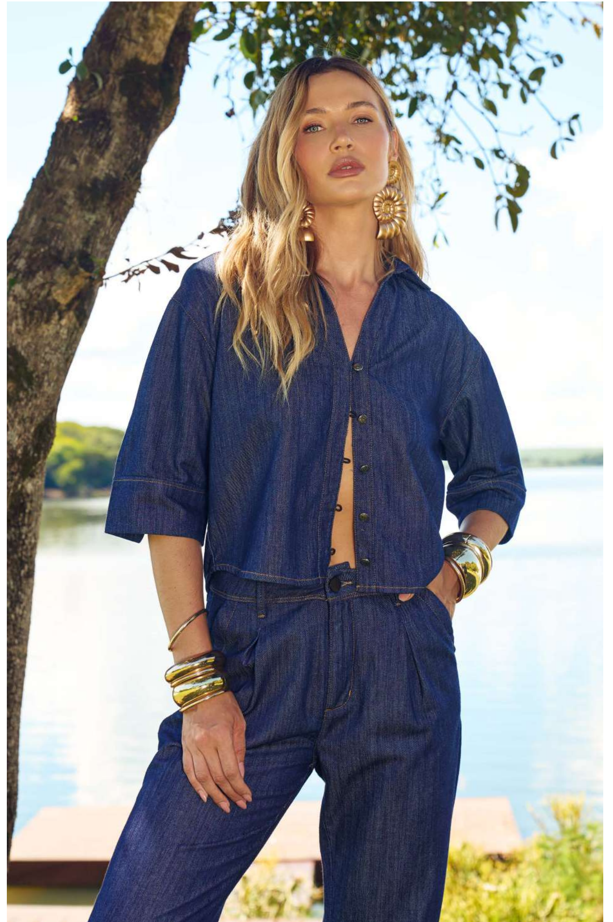
RENASCER | PRIMAVERA 2026 | ASD JEANS